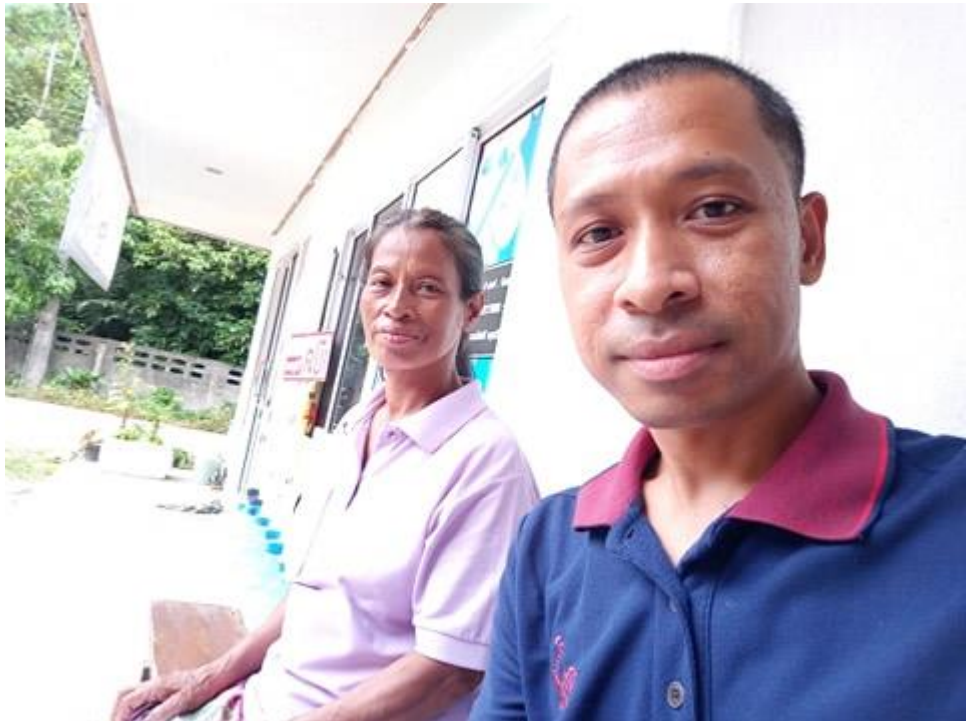
ภาพกิจกรรม การสัมภาษณ์