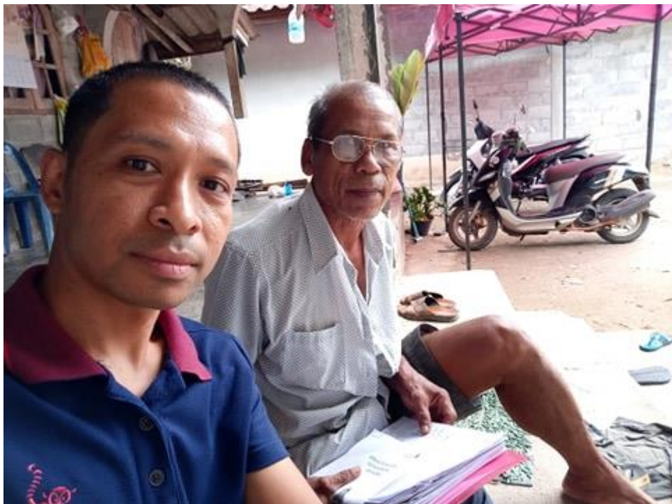
ภาพกิจกรรม การสัมภาษณ์