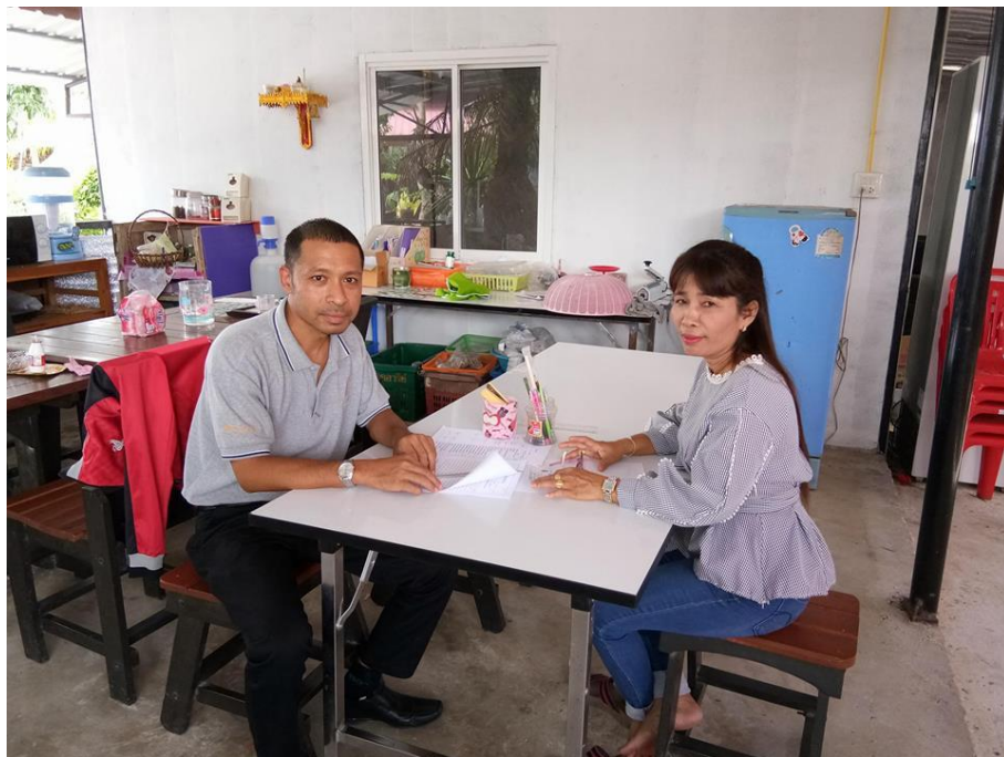
ภาพกิจกรรม การนำเครื่องมือให้ผู้เชี่ยวชาญ