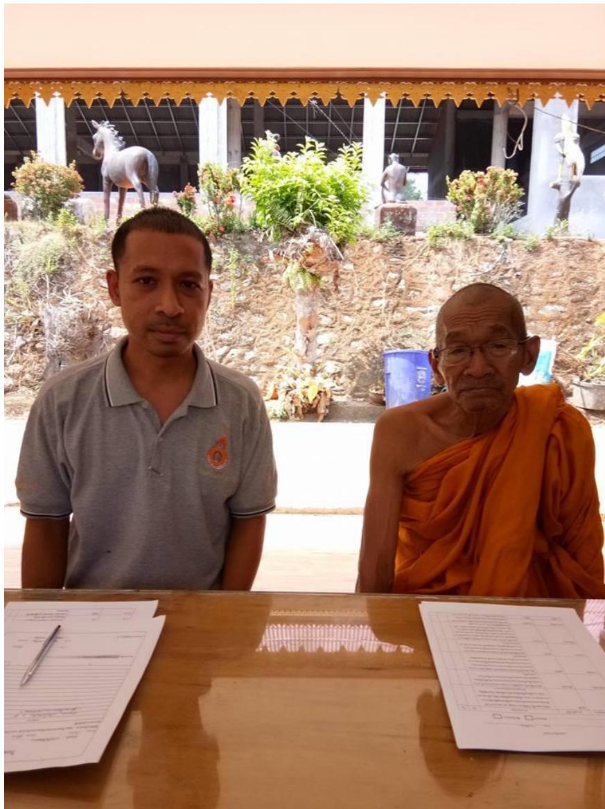
ภาพกิจกรรม การนำเครื่องมือให้ผู้เชี่ยวชาญ