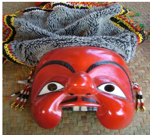
รูปที่ 12 หน้านายพราน

2.5) อุปกรณ์ประกอบพิธี คือ สิ่งของที่มีความสำคัญและศักดิ์สิทธิ์ถือเป็นสัญลักษณ์ของคณะโนราบุญญา เพชร เรือนทอง มีความเชื่อว่าของเหล่านี้จะต้องนำมาใช้ทุกครั้งที่มีการประกอบพิธีกรรมหากขาดสิ่งหนึ่งสิ่งใดไปพิธีกรรมจะไม่สำเร็จ เช่น เทริด หน้ากานายพราน