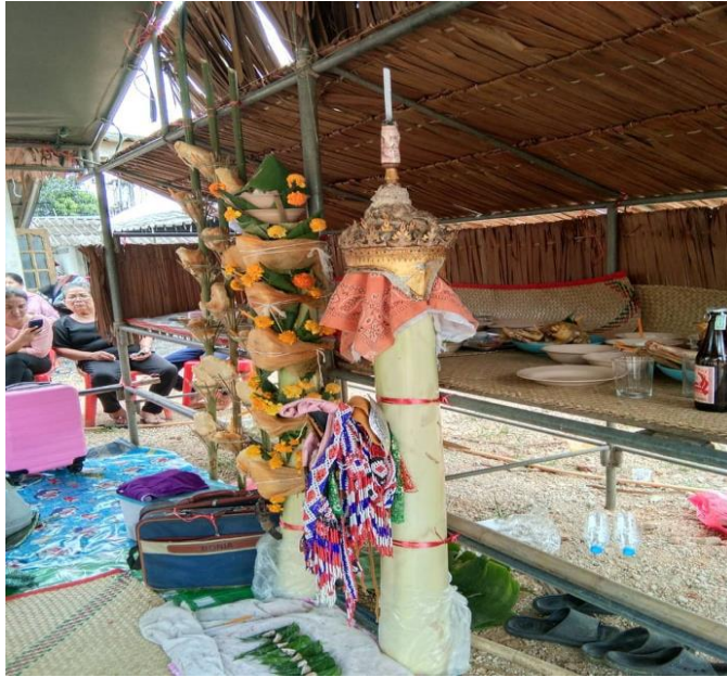
รูปที่ 6 ลักษณะโรงโนราโรงครูเล็ก