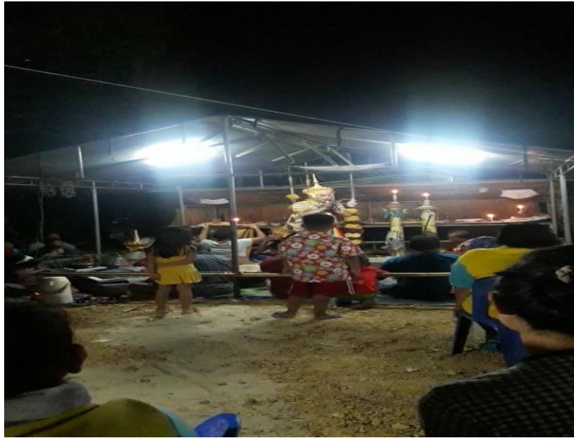
รูปที่ 16 บุคคลทั่วไปที่มีารับชมการแสดงโนรา

2.9) ผู้เข้าร่วมประกอบพิธีในโรงครู คือ บุคคลที่มีส่วนร่วมในพิธีกรรมครุหมอโนรามิ 3 ส่วน ประกอบด้วย คณะโนราและนายโรง เจ้าภาพงาน (ผู้ประสงค์จะประกอบพิธีกรรมต่าง ๆ) บุคคลทั่วไป