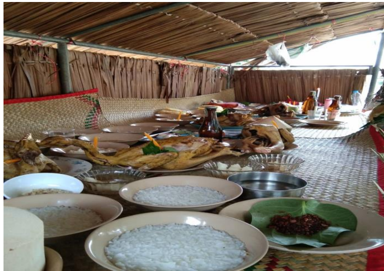
รูปที่ 13 เครื่องเซ่นไหว้

2.6) เครื่องบูชาประกอบพิธี คือ สิ่งของที่ใช้เป็นเครื่องบูชาหรือเซ่นไหว้ครุหมอโนราคะโนราบุญญา เพชรเรือนทองจะประกอบไปด้วย อาหารคาว หวาน เครื่องดื่ม ผลไม้ ดอกไม้ รูปเทียน เงิน เช่นหัวหมูต้ม ไก่บ้านต้ม หมาก พลุ ดอกไม้ ข้าวตอก เหล้าขาว บุหรี่ รูป เทียน อาหารคาว อาหารหวาน มะพร้าวอ่อน