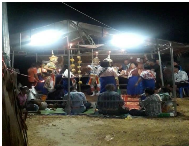
รูปที่ 3 ร่างทรงที่กำลังมีการประทับร่างในพิธีแก๊บน

2.2) ความเชื่อเรื่องร่างทรง คือ พิธีกรรมที่ใช้ร่างทรงเพื่อติดต่อกันระหว่างคนทั่วไปกับบรรพบุรุษที่ล่วงลับไปแล้ว เรียกว่าร่างทรงซึ่งจะมี 2 ลักษณะ คือ ร่างทรงที่เป็นเชื้อสายของโนราและสมัครใจจะเป็นร่างทรงกับร่างทรงที่ไม่ได้เป็นเชื้อสายโนราแต่สมัครใจจะเป็นร่างทรง ประชาชนในพื้นที่วิจัยจะมีความเชื่อและศรัทธาในตัวของร่างทรงเพราะถือว่าเป็นผู้ที่มีความศักดิ์สิทธิ์สามารถช่วยเหลือให้พบกับความสุขความเจริญรุ่งเรืองหรือรักษาอาการเจ็บป่วยได้ เช่น เมื่อมีอาการเจ็บป่วยแล้วรักษาด้วยวิธีทางการแพทย์แผนปัจจุบันไม่หายก็จะพึ่งพาร่างทรงเพื่อสอบถามสาเหตุการเจ็บป่วยและวิธีการรักษาโดยมีความเชื่อว่าร่างทรงดังกล่าวมีวิชาสามารถรักษาผู้ป่วยด้วยคาถาอาคมให้อาการดีขึ้นและหายได้ในที่สุด พิธีกรรมการเข้าทรงหรือร่างทรงจะเริ่มต้นจากผู้ที่เป็นร่างทรงเข้ามายังบริเวณโรงโนรา ที่บ้านของผู้มาติดต่อหรือบ้านของคนทรง และแต่งตัวเพื่อรอรับการประทับร่างทรงจากครูหมอโนราหลังจากนั้นลูกหลานหรือผู้ที่ต้องการจะติดต่อกับร่างทรงนำเครื่องบูชาครูหมอโนราอันประกอบด้วยดอกไม้ ธูป เทียน หมากพลู อาหาร น้ำ เหล้าขาว โดยจัดวางลงบนผ้าสีขาวแล้วนำไปวางไว้สำหรับตั้งเครื่องรับครูหมอ อาจจะเป็นครู หรือหิ้ง เมื่อทุกอย่างพร้อม ผู้ที่มาติดต่อก็จุดเทียนและอธิษฐานถึงสาเหตุที่มาติดต่อเพื่ออันเชิญครูหมอโนรามาประทับร่างทรง เมื่อร่างทรงมีอาการตัวสั่นผู้ที่ทำหน้าที่สื่อสารก็จะถวายหมากพลู น้ำ เหล้าขาวแล้วก็สอบถามชื่อหรือองค์ร่างทรงที่มาประทับร่าง ต่อด้วยการพูดคุยสอบถามเรื่องราวต่าง ๆ หรือรักษาอาการเจ็บป่วยระหว่างผู้มาติดต่อกับร่างทรงจนหมดคำถาม หลังจากนั้นร่างทรงก็จะสะบัดตัวและจะกลายมาเป็นคนเดิม ถือเป็นเสร็จพิธี