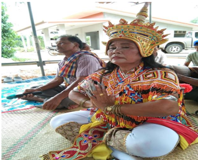
รูปที่ 15 โนราสวมเครื่องแต่งตัวทั้งหมด

2.7) เครื่องดนตรีและลูกคู่ เครื่องดนตรีคือ อูปรกรณ์ที่ทำให้เกิดจังหวะหรือทำนอง เครื่องดนตรีของคณะโนรา บุญญา ประกอบด้วย กลอง (รำมะนา) ทับคู่ ปี่นอก ปี่ใน ฉิ่ง กรับ โหม่ง ลูกคู่ คือ บุคคลที่ทำหน้าที่เล่นดนตรีและร้องรับบท ร้องจากโนราขณะทำการแสดงมีจำนวน 5-6 คน