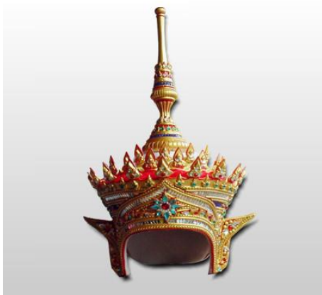
รูปที่ 11 เทริด

2.4) โรงพิธีหรือโรงครู คือ การก่อสร้างโรงเรือนชั่วคราวขึ้นเพื่อประกอบพิธีกรรมโนราโรงครู คณะโนราบุญญา เพชร เรือนทอง ใช้วัสดุที่ทำด้วยเหล็ก ไม้ไผ่ แผ่นจาก ขนาดกว้าง 4 เมตร ยาว 5 เมตร ประกอบด้วยเสา 6 เสา แบ่งออกเป็น 3 ตอน