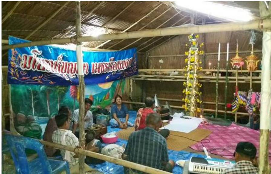
รูปที่ 9 โรงพิธีหรือโรงครูที่ทำด้วยไม้ไผ่

2.3) ระยะเวลาในการทำพิธี คือ ช่วงเวลาที่นิยมใช้ในการประกอบพิธีกรรมสำหรับโนราคณะบุญญา เพชรเรือนทอง ช่วงเวลาที่นิยมทำพิธีกรรมคือเดือนสี่ เดือนหก เดือนเจ็ด เดือนเก้า เดือนสิบเอ็ด เดือนสิบสอง ยกเว้นเดือนอ้าย เดือนสาม เดือนห้า เดือนแปด และเดือนสิบตามปฏิทินแบบจันทรคติที่ห้ามทำพิธีกรรม และไม่จำกัดวันข้างขึ้นหรือข้างแรม พิธีกรรมโนราโรงครูใหญ่ใช้เวลา 3 วัน เริ่มในวันพุธช่วงเย็น สิ้นสุดลงในวันศุกร์ ส่วนโนราโรงครูเล็กใช้เวลา 1 วัน คือ วันพฤหัสบดี