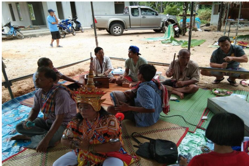
รูปที่ 14 คณะโนรากำลังเล่นเครื่องดนตรี

2.6) เครื่องบูชาประกอบพิธี คือ สิ่งของที่ใช้เป็นเครื่องบูชาหรือเซ่นไหว้ครุหมอโนราคะโนราบุญญา เพชรเรือนทองจะประกอบไปด้วย อาหารคาว หวาน เครื่องดื่ม ผลไม้ ดอกไม้ รูปเทียน เงิน เช่นหัวหมูต้ม ไก่บ้านต้ม หมาก พลุ ดอกไม้ ข้าวตอก เหล้าขาว บุหรี่ รูป เทียน อาหารคาว อาหารหวาน มะพร้าวอ่อน