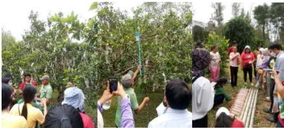
ภาพที่ 20 สวนผลไม้แหล่งหาอาหารของผึ้งผึ้ง