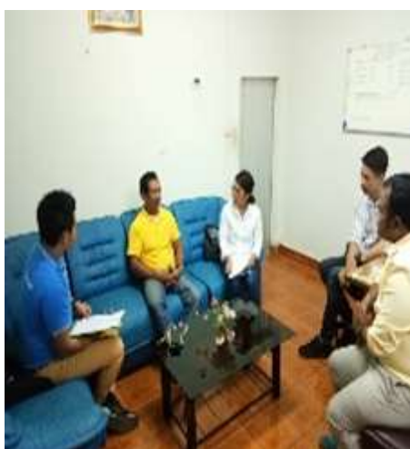
ภาพที่ 3 การสัมภาษณ์ชาวบ้านในชุมชนนาหมื่นศรี

สรุปประเด็นสำคัญจากการสัมภาษณ์ประชาชน เกษตรกร เจ้าของสวนเกษตร และผู้นำชุมชนนาหมื่นศรี พบว่า ประชาชนส่วนใหญ่มีความคิดเห็นว่า ชุมชนมี ทรัพยากรการท่องเที่ยวส่วนใหญ่เป็นด้านการเกษตรที่หลากหลาย การเดินทางมีความสะดวกสบายมี ที่พักชุมชนไว้ให้บริการนักท่องเที่ยว ในด้านการบริหารจัดการชุมชนกำลังริเริ่มจัดการการท่องเที่ยว โดยชุมชนแต่ยังไม่ได้รวมกลุ่มผู้รับผิดชอบและวางแผนดำเนินการท่องเที่ยวอย่างเป็นรูปธรรม ทั้งนี้ ชุมชนเห็นว่าการพัฒนาการจัดการการท่องเที่ยวเชิงเกษตรอย่างยั่งยืนในชุมชน ควรเป็นการรวมกลุ่ม บริหารจัดการการท่องเที่ยวโดยการริเริ่มของผู้นำชุมชนและผู้นำกลุ่มวิสาหกิจชุมชน และให้สมาชิกใน ชุมชนมีส่วนร่วมในการจัดการการท่องเที่ยวที่ โดยพัฒนาเป็นเป็นฐานการเรียนรู้ จุดสาธิตการผลิต และทดลองทำการเกษตร เพื่อสร้างประสบการณ์เรียนรู้แก่นักท่องเที่ยว ทั้งนี้ ชุมชนมีความความ ต้องการมีส่วนร่วม และอยากเป็นส่วนหนึ่งในการพัฒนาการท่องเที่ยวเชิงเกษตรอย่างยั่งยืนในการ ดูแลต้อนรับนักท่องเที่ยว มีความตระหนักถึงประโยชน์ของการจัดการท่องเที่ยวที่จะทำให้คนในชุมชน มีโอกาสสร้างรายได้มากขึ้น และเสนอให้หน่วยงานภาครัฐที่เกี่ยวข้องควรเข้ามาสนับสนุนการ พัฒนาการท่องเที่ยวของชุมชนอย่างต่อเนื่อง