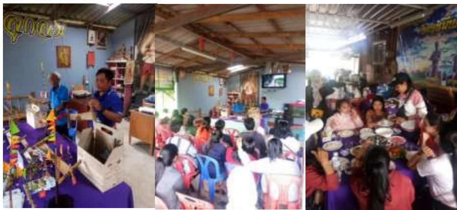
ภาพที่ 13 สาธิตการทำลูกกลม หรือกั้งหันลมและรับประทานอาหารกลางวัน