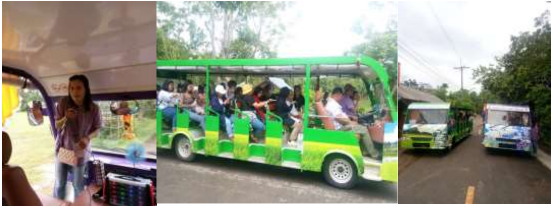
ภาพที่ 9 รถลางรอกนำเที่ยว