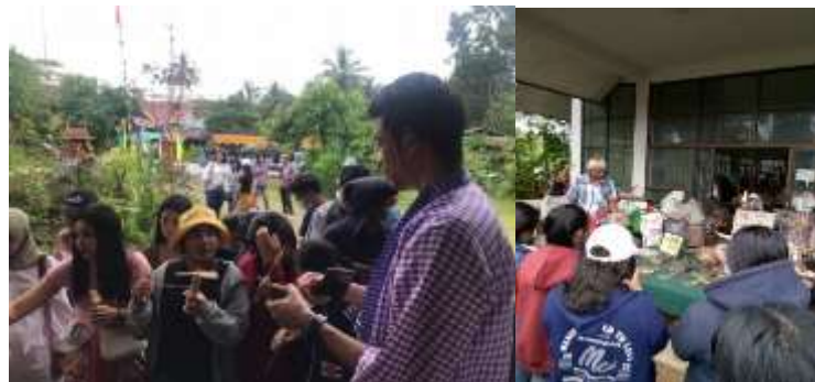
ภาพที่ 10 พิพิธภัณฑ์พื้นบ้าน