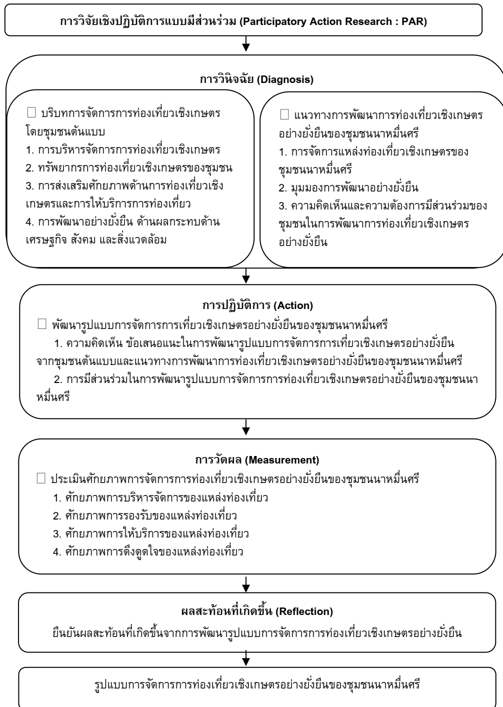
ภาพที่ 2 กรอบแนวความคิดของโครงการวิจัย