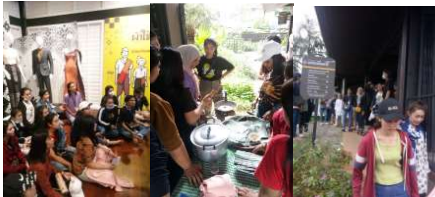
ภาพที่ 22 กลุ่มทอผ้าผ่านหมี่นตรีและฝึกทำขนมฝามี