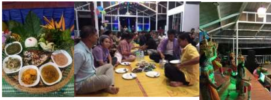
ภาพที่ 16 สำหรับอาหารเย็นและการแสดงของชุมชน