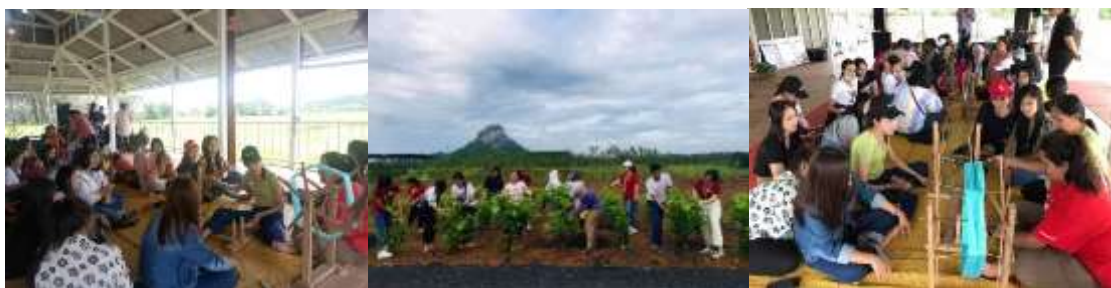
ภาพที่ 14 สาธิตสาวเส้นใยไหมและเก็บผลมัลเบอร์รี่