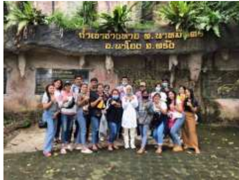
ภาพที่ 15 ถ้าเขาช้างหาย