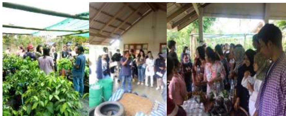
ภาพที่ 11 ศูนย์การเรียนรู้สวนเศรษฐกิจพอเพียง