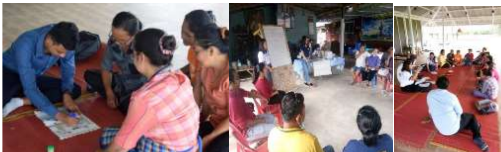
ภาพที่ 7 การอบรมเชิงปฏิบัติการ

บ้านที่ดี และการจัดการทรัพยากรการท่องเที่ยวเชิงเกษตรอย่างยั่งยืน เพื่อเตรียมความพร้อมของกลุ่มสมาชิกผู้ที่มีส่วนเกี่ยวข้องในการต้อนรับนักท่องเที่ยวต่อไป