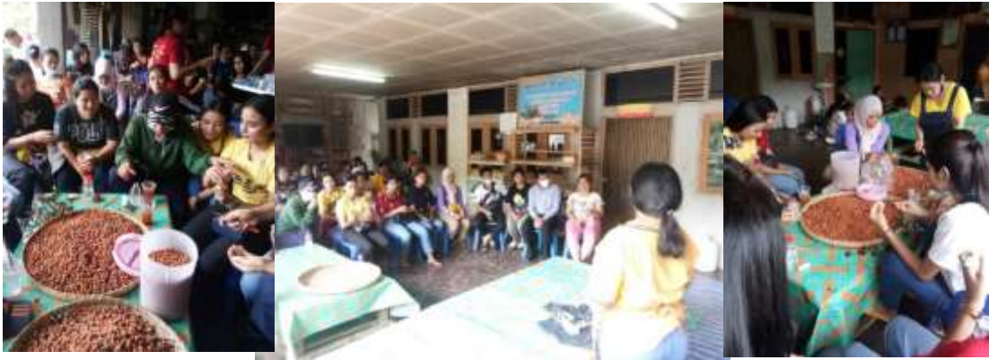
ภาพที่ 21 การแปรรูปผลิตภัณฑ์จากลูกกาแฟ