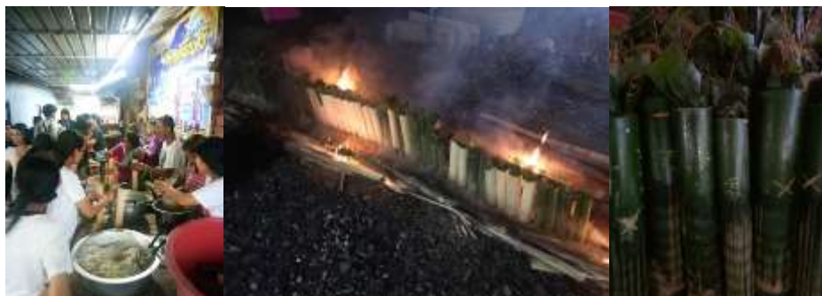
ภาพที่ 17 กิจกรรมหลามข้าวเหนียวรอบกองไฟ