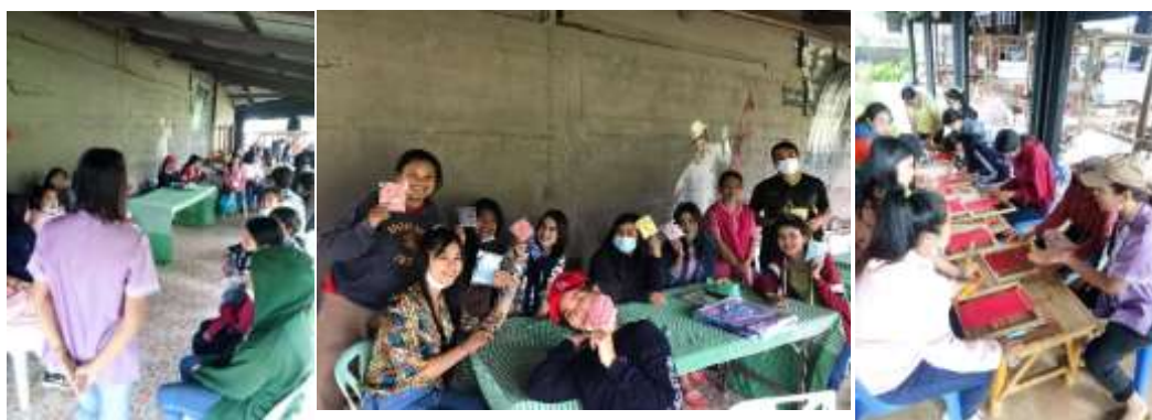
ภาพที่ 8 กล่าวต้อนรับ พร้อมกิจกรรมสาธิตทดลองทอผ้าและกิจกรรมฝึกทำผ้าเช็ดหน้า

1) ผลการจัดท่องเที่ยวনার่องเพื่อประเมินรูปแบบการจัดการการท่องเที่ยวเชิงเกษตรอย่างยั่งยืนของชุมชนนาหมื่นศรี การจัดท่องเที่ยวনার่องเป็นขั้นตอนการดำเนินงานเพื่อตรวจสอบรูปแบบการจัดการการท่องเที่ยวเชิงเกษตรอย่างยั่งยืนของชุมชนนาหมื่นศรี โดยการจัดท่องเที่ยวনার่องตามแผนปฏิบัติการท่องเที่ยวเชิงเกษตรที่ได้วางไว้จากการประชุมเชิงปฏิบัติการ โดยมีโปรแกรมการท่องเที่ยวเชิงเกษตรโดยชุมชนนาหมื่นศรี ระยะเวลา 2 วัน 1 คืน และได้ประเมินความพึงใจของนักท่องเที่ยวต่อศักยภาพของแหล่งท่องเที่ยวเชิงเกษตรโดยชุมชนนาหมื่นศรี มีรายละเอียดดังนี้