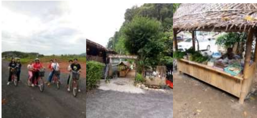
ภาพที่ 18 ปั่นจักรยานยามเช้าและเยี่ยมชมตลาดนัดชุมชน