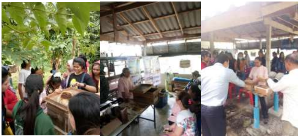
ภาพที่ 19 สาธิตวิธีการเลี้ยงและเก็บน้ำผึ้ง