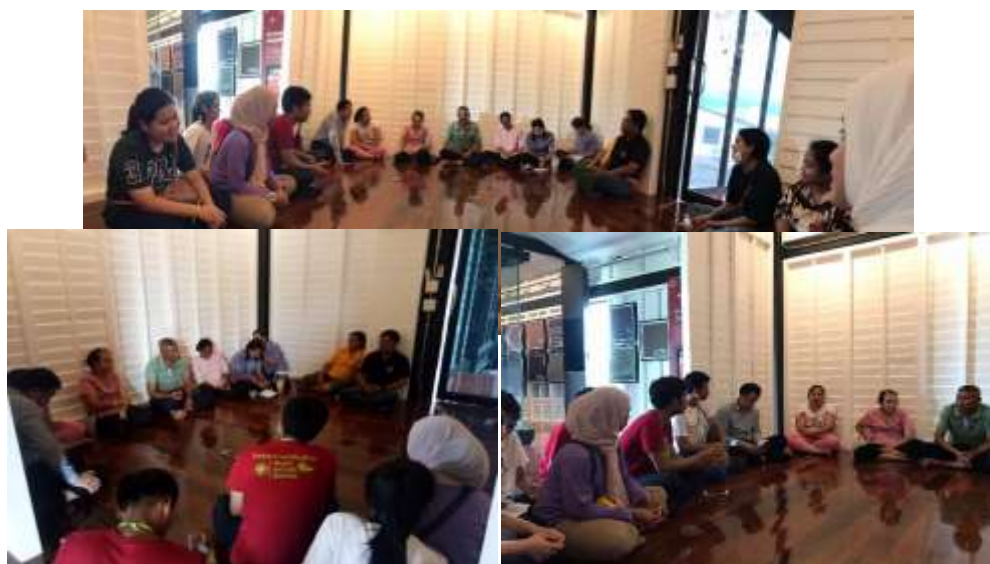
ภาพที่ 23 การสนทนากลุ่ม

การสร้างเครือข่ายความร่วมมือโดยมีบุคคลทั้งภายในและภายนอกชุมชนเป็นที่ปรึกษา วางแผนจัดกิจกรรมเพื่อพัฒนาบุคลากรอย่างต่อเนื่อง และกำหนดให้มีนโยบายการดำเนินงานไว้ในแผนพัฒนาการท่องเที่ยวของชุมชน นอกจากนี้ควรจัดให้มีการประชาสัมพันธ์แหล่งท่องเที่ยวให้เป็นที่รู้จัก และถ่ายทอดการเรียนรู้สู่เด็กและเยาวชนหรือนักท่องเที่ยวผู้มาเยือน ทั้งนี้ย่อมทำให้ชุมชนมีประสบการณ์ในการพัฒนารูปแบบการจัดการการท่องเที่ยวเชิงเกษตรอย่างยั่งยืน