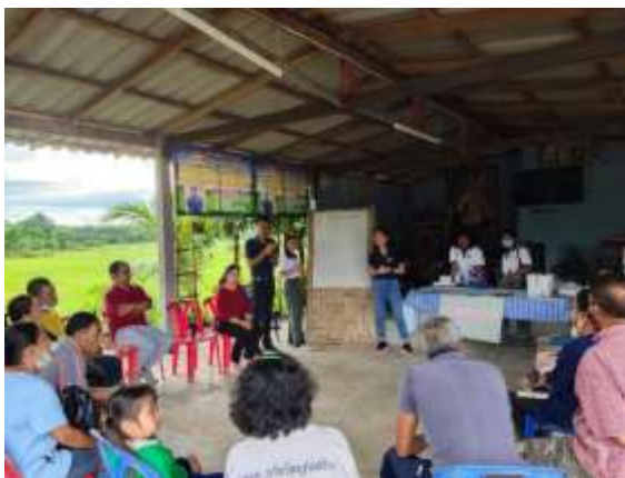
ภาพที่ 5 การประชุมเชิงปฏิบัติการ

ประเด็นที่ 5 ผลที่คาดว่าจะเกิดขึ้นจากการจัดกิจกรรม คือ ชุมชนมีความรู้ เกิดความตื่นตัวในการจัดการท่องเที่ยว คนในชุมชนมีคุณภาพชีวิตที่ดี สร้างความสามัคคีในชุมชน สร้างรายได้เข้าชุมชน และสามารถดึงดูดให้นักท่องเที่ยวเข้ามาเที่ยวชมในชุมชนนาหมื่นศรี ซึ่งจากเดิม มาเพียงชมบรรยากาศและถ่ายภาพเพียงอย่างเดียว แต่ในอนาคตมีนักท่องเที่ยวมาศึกษาเรียนรู้ กิจกรรมการเกษตรเพิ่มมากขึ้น