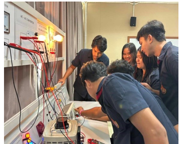
รูปที่ 3 การทดลองใช้สื่อที่นักเรียนกลุ่มตัวอย่าง